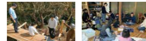
地域ビジネスの作り方をサポートする「EDGE CAMP」実施中。移住相談も。