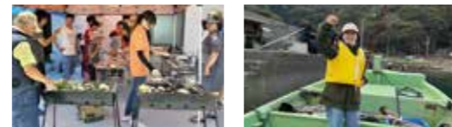
須崎市内でのワーキングホリデーの受け入れ支援も行っています。

須崎市の移住相談窓口です。空き家バンクの運営や移住者と地元住民をつなぐ交流会などを年2回ほど開催しています。