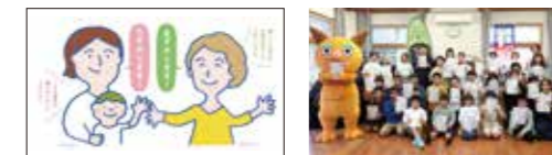
地域体験イベント「かみめぐり」も実施。

オーダーメイドの現地案内やお試し住宅の運営、ファミリーサポートセンターとの連携など実施。オンライン面談も受付中。