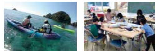
多世代交流の場を運営中。